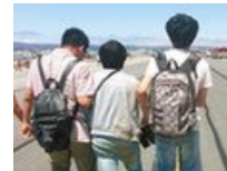
美国坠机两中学生遇难