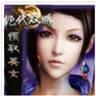
万人在线，火爆阵营，首款3D武侠大作出世