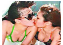
盘点私生活混乱的港姐