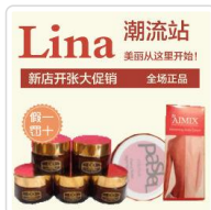
从心美丽，感动自己 - 泰优缘泰国代