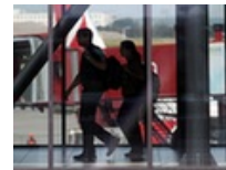
斯诺登申请庇护信曝光