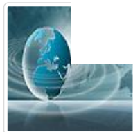
中国民航与空客公司签署航空安全合作协议