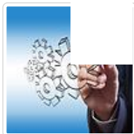
空客中国公司总裁陈菊明：多管齐下促中国民航可持续发展