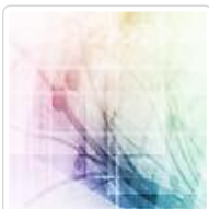
空客公司将与中国民航全面合作应对航空安全挑战