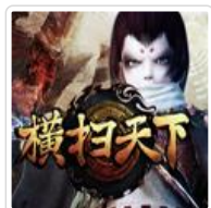
横扫多部武侠文学典藏，集结四朝恩怨情仇-2013 3D网游巨制