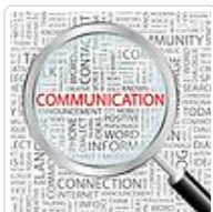
“中国民航大学河南教育中心”7月11日揭牌