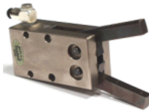
Pince de robot PARKER

Cette pince est un composant mécanique qui grâce à un piston 2 convertit l'énergie pneumatique en énergie mécanique de translation. Deux bielles 4a-4b transmettent le mouvement aux deux doigts. Les deux doigts en liaison pivot avec le corps de la pince sont alors mis en mouvement de rotation.