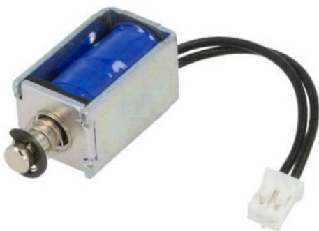
Figure 3 : Solénoïde sélectionné (Référence : ZH0 – 0420S – 05A4.5).

Dans l'optique d'introduire un nouveau mode de fonctionnement qui permettrait une fréquence réglable des lancers des balles, une solution est d'utiliser un actionneur électromécanique de type solénoïde (figure 3). Celui-ci permettra, à chaque impulsion de commande, de libérer une balle.