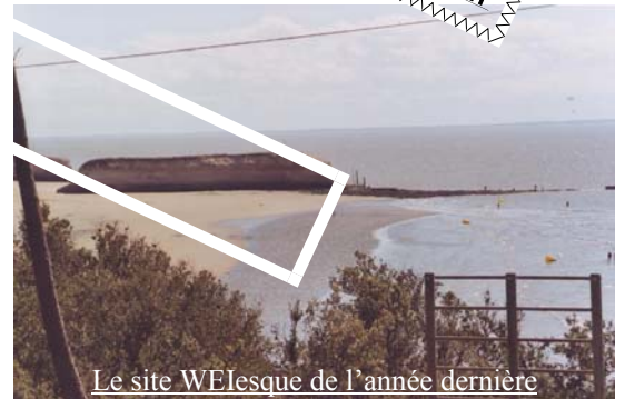
Le site WEIesque de l'année dernière

Te voilà dans cette École, L'ENS Cachan et, comme chaque année tu te sens un peu perdu. Et même sûrement davantage qu'auparavant puisque tu te rends compte qu'il va te falloir faire fonctionner tes centres mémoriels à plein régime pour assimiler les prénoms de ceux qui vont maintenant faire partie de ton quotidien, tous nouveaux pour toi, compagnons de tranchée comme les soudards des précédentes guerres, tes aînés. Et encore, « aînés » est un bien grand mot... car ici pas de hiérarchie strictement établie entre les promotions, pas de devoirs outranciers en vertu d'un soi-disant « respect ». Tu te rendras vite compte que ça ressemble plutôt à une société utopique où tout un chacun est appelé à coopérer... mais n'allons pas trop vite en besogne !