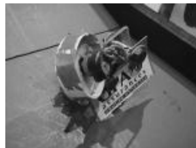
Outre un beau gros robot (qu'on ne vous montrera pas...), le krobot sait aussi faire des trucs qui ne ressemblent à rien mais qui percent des ballons...

PS : mais bon, les filles ne sont pas vaches du tout là-bas, au contraire ! Cf article suivant.