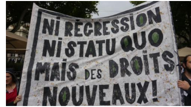
Manifestation des intermittents, Avignon, juillet 2014

Les partenaires sociaux ont joué leur rôle habituel, mais sans intégrer dans la négociation deux parties importantes : la CGT qui est dominante dans le secteur des spectacles et les coordinations qui sont ressuscitées à chaque crise. On a donc vu, comme à l'accoutumée, une politisation très rapide du conflit, avec une implication de l'acteur public.