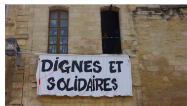
Avignon, vendredi 4 juillet

secteurs économiques. Le déficit de l'annexe 4 des intérimaires peut donc facilement appeler à la solidarité interprofessionnelle.