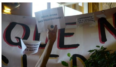
Avignon, jeudi 3 juillet

aussi fragmenté, aucun acteur ne peut avoir une vision globale de ce qu'engendrent les décisions de tous les autres. Il y a bien sûr de gros employeurs qui se servent largement du système, mais dénoncer les abus ne suffit pas pour décrire ce qui se passe. Le nombre d'employeurs a en fait augmenté plus vite que le nombre de salariés. Et la fonction d'employeur dans le secteur de l'intermittence est non seulement très hétérogène, mais elle s'est miniaturisée.