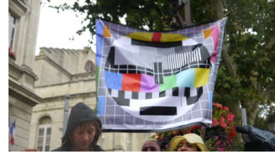
Manifestation des intermittents, Avignon, juillet 2014

un tiers d'indemnité chômage et pour deux tiers de salaires, tandis que, pour les artistes, c'est du 50/50, là encore en moyenne.