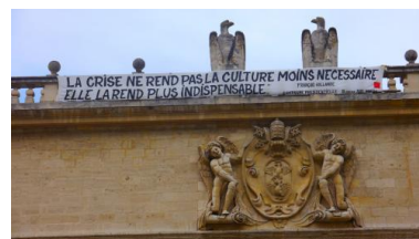
Avignon, vendredi 4 juillet

Cette information asymétrique est un sérieux problème. On répète souvent que la culture est un secteur formidable, que c'est la réussite fantastique du pays, que cela produit plus de richesse et d'emplois que l'automobile, que cela a un impact considérable sur le tourisme et les territoires... Ce sont des arguments réels. Toutefois, si on dit cela, on doit aussi avoir de la maturité dans la gestion des relations sociales dans le monde de la culture, et ce n'est pas le cas pour l'instant.