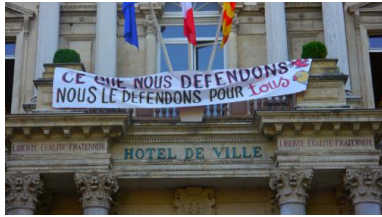
Banderole accrochée sur la mairie d'Avignon, 3 juillet

après 1945. Non seulement elle module les cotisations en fonction du risque que les employeurs font prendre à leurs employés, mais elle prévoit aussi que les petites entreprises vont mutualiser leurs cotisations d'accidents du travail, tandis que les grandes entreprises seront directement comptables de leur gestion du risque.