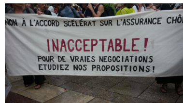
Manifestation des intermittents, Avignon, juillet 2014

dans le système est considérable et qu'il bouscule la démographie professionnelle des métiers et la longévité des carrières.