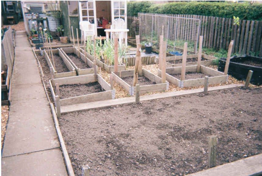
FIGURE 6 – Circulation des choses et présentation de soi. Cette image est une photographie de la parcelle de Ron, telle qu'elle est vue depuis l'allée, donc par tous les jardiniers qui entrent sur le lotissement : ils passent forcément devant cette porte, après l'entrée principale, que Ron laisse toujours ouverte. Les jardiniers qui le connaissent reconnaissent dans ces éléments les divers dons qui lui ont été fait : la cabane, les grilles en métal, les dalles, les planches des plates-bandes et les tasseaux qui les tiennent lui ont tous été donnés par des jardiniers différents ; les chaises viennent de chez lui. Il met ainsi en scène son intégration dans les réseaux d'échange au lotissement, dans un palimpseste visuel des cadeaux. Cette possibilité d'une mise en scène de soi est une qualité supplémentaire justifiant l'attrait des parcelles situées près de l'entrée, pour les jardiniers construisant leur statut dans une valorisation tirée des échanges : ce sont des lieux où voir et être vu.