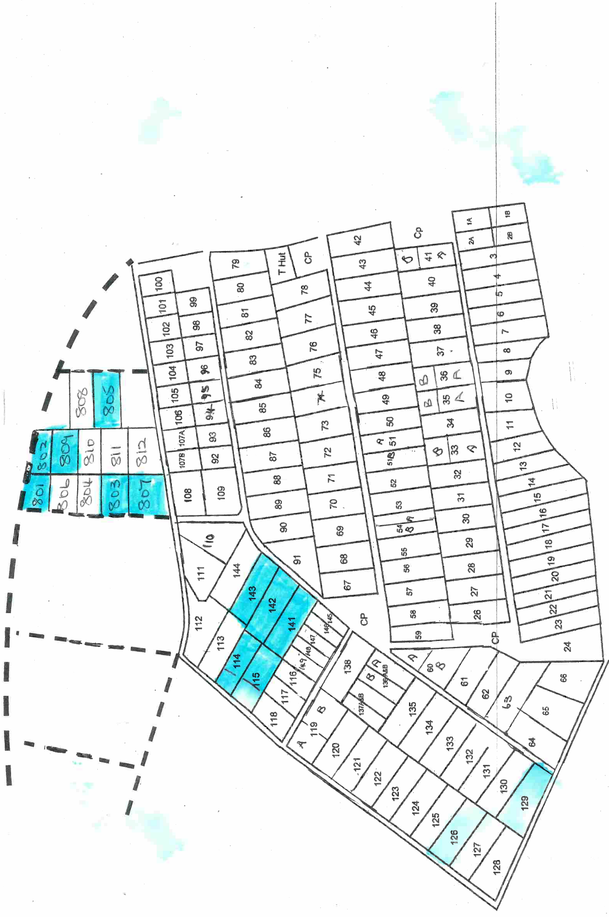
FIGURE 1 – Plan du LSA. Ne pas tenir compte des couleurs, indiquant des parcelles qui allaient se libérer en février. L'orientation cardinale suit l'orientation géométrique de cette page : les parcelles 801 et 806 sont les plus au nord.