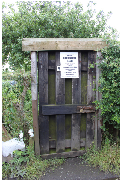
FIGURE 4 – Territorialisation du comité (1) . Le comité impose ses signes dans l'espace du lotissement, sur des éléments spatiaux associés aux jardiniers. Ici, une affiche pour un événement organisé par le comité des fêtes a été agrafée sur une porte de parcelle.