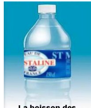
La boisson des communistes qui ont du goût !