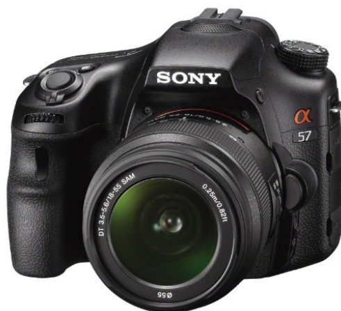
(a) Sony SLT-Alpha57